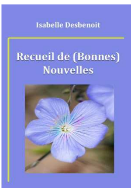
Recueil de (Bonnes) Nouvelles (2014)