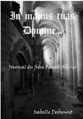
In manus tuas Domine.... (2009)